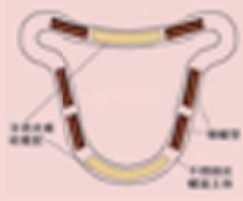
含药含铜元宫型节育器（结构图）