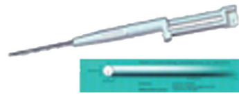
单根型皮下埋植剂